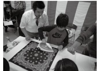
「おうみしごとフェスタ」 （テクノカレッジ草津） クリーニング体験