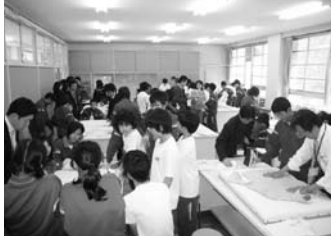
河南中学校について

生の百名を対象に「寿し」および「クリーニング」の体験実習を行いました。寿しの歴史についてのお話し、日本の寿しの源流が鮎を説明した後に、にぎりや巻寿司などの実