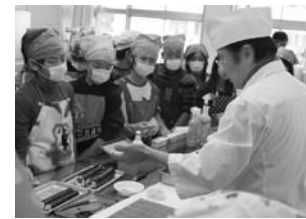
八日市北小学校 すし

「理容」の体験実習をしました。巻き寿司およびにぎり寿司の実演を行った後、全員に巻き寿司にぎつたり体験してもらいました。理容では、校長先生や担任の先生をモデルにカットやセットの実演をした後、モデルウイッグを使って実際にカットしたり、ロットを巻いたりして体験してもらいました。