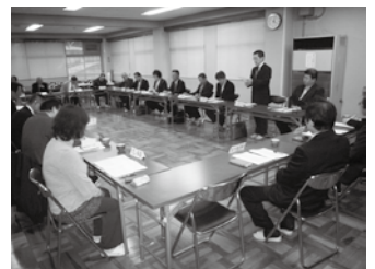
第3回指導センター理事会 生衛会館 （12月5日）