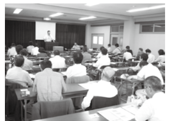
経営相談員・特別相談員研修会 生衛会館（9月10日）