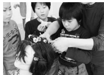
八日市北小学校 ロット巻き

「理容」の体験実習をしました。巻き寿司およびにぎり寿司の実演を行った後、全員に巻き寿司にぎつたり体験してもらいました。理容では、校長先生や担任の先生をモデルにカットやセットの実演をした後、モデルウイッグを使って実際にカットしたり、ロットを巻いたりして体験してもらいました。