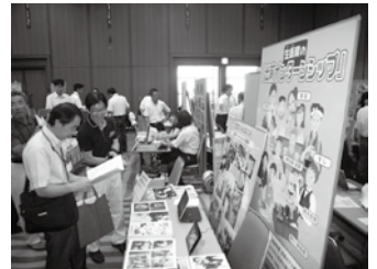
学校支援メニューフェアに出店 （ピアザ淡海）