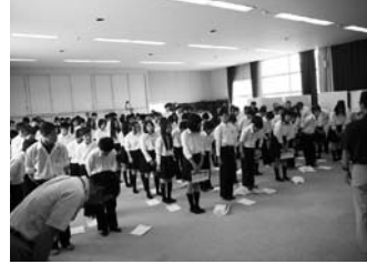
あいさつとおじぎの練習をしました

米原市立河南中学校 四十八名を対象に「クリーニング」の体験実習を行いました。クリーニングに関する専門的知識と歴史のお話の後、クリーニング師によるカッターシャツを使つてのアイロン掛け、たたみ方などの実演をしてもらいました。後半は、ハンカチやカッターシャツを使つてのアイロン掛けの体験をしてもらいました。