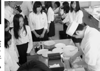
東中学校について