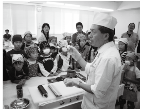
10月15～16日おうみ仕事体験フェスタ (テクノカレッジ草津)