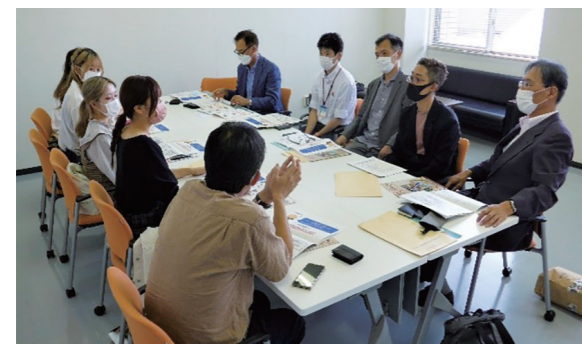
立命館大学で学生と関係者との打ち合わせの様子