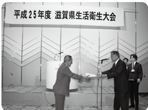
平成25年度 滋賀県生活衛生大会