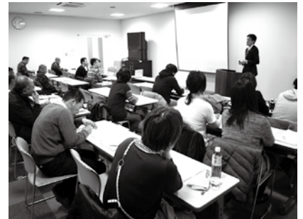
中井顧問弁護士による苦情対応のお話

平成二十四年度は県下2会場4回開催しましたところ、クリーニング師にあっては72名が、業務従事者にあつては68名が受講されました。