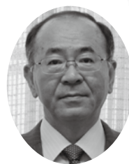
株式会社日本政策金融公庫 彦根支店長兼国民生活事業統轄