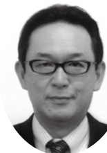
株式会社日本政策金融公庫 大津支店長兼国民生活事業統轄