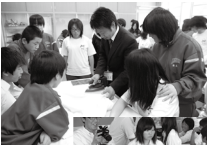
クリーニング生活衛生同業組合による実演 (米原市立河南中学校)