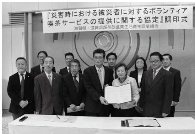
『災害時における被災者に対するボランティア 喫茶サービスの提供に関する協定』調印式 滋賀県・滋賀県喫茶飲食業生活衛生同業組合

当指導センターでは、今後、 生衛業の包括的な協定策も眼 下に、さらにこういった災害 時支援事業の推進を図る予定 です。