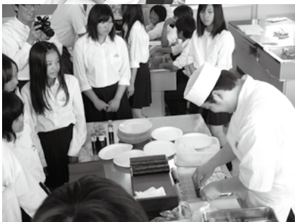
すし・料理生活衛生同業組合による実演(長浜市立東中学校)

平成二十四年四月二十日(金)米原市立河南中学校の二年生四十八名を対象に、クリーニング生活衛生同業組合の協力により、アイロン掛け・正式なたたみ方などの実演を行い、実際にハンカチを使つてのアイロン掛け、カッターシャツのアイロン掛け等を体験してもらいました。 また、六月七日(木)には長浜市立東中学校の二年生百三名を対象に、すし・料理生活衛生同業組合の協力により、細工寿司・巻き寿司・にぎりの実演を行うとともに、クリーニング生活衛生同業組合の協力により、アイロン掛け・正式なたたみ方などの実演と体験してもらいました。 実施に先立ち、当指導センターの谷本専務理事より「仕事と生衛業」について説明した後、学校が実施している職場体験学習に当たつての「あいさつ」の大切さについて話をした後に、生徒全員で練習しました。