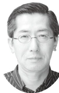
滋賀県健康福祉部