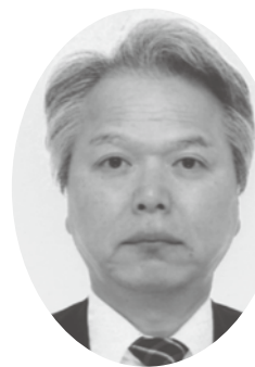
株式会社日本政策金融公庫